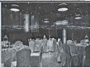
Τιμή με πρωινό 158 € (€)