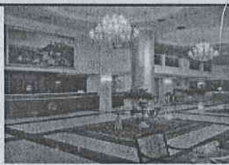
Τιμή με ημιδιατροφή 189 € (€)