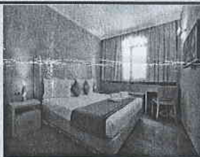
A' Cat ★★★★