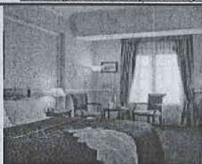
Τιμή με πρωινό 159 € (€)