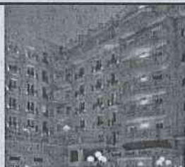
De Lux ★★★★★