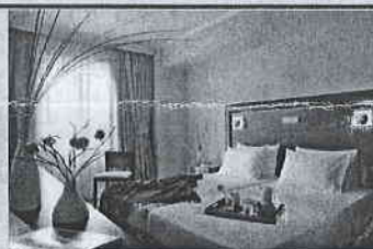
Τιμή με ημιδιατροφή 179€